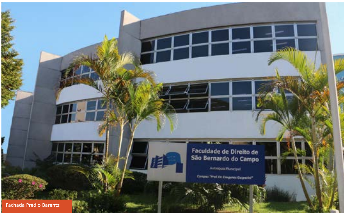
Fachada Prédio Barentz

TRADITION AND EXCELLENCE: FDSBC COMBINES QUALITY TEACHING WITH SOCIAL ACTION FOR THE COMMUNITY IN SÃO BERNARDO