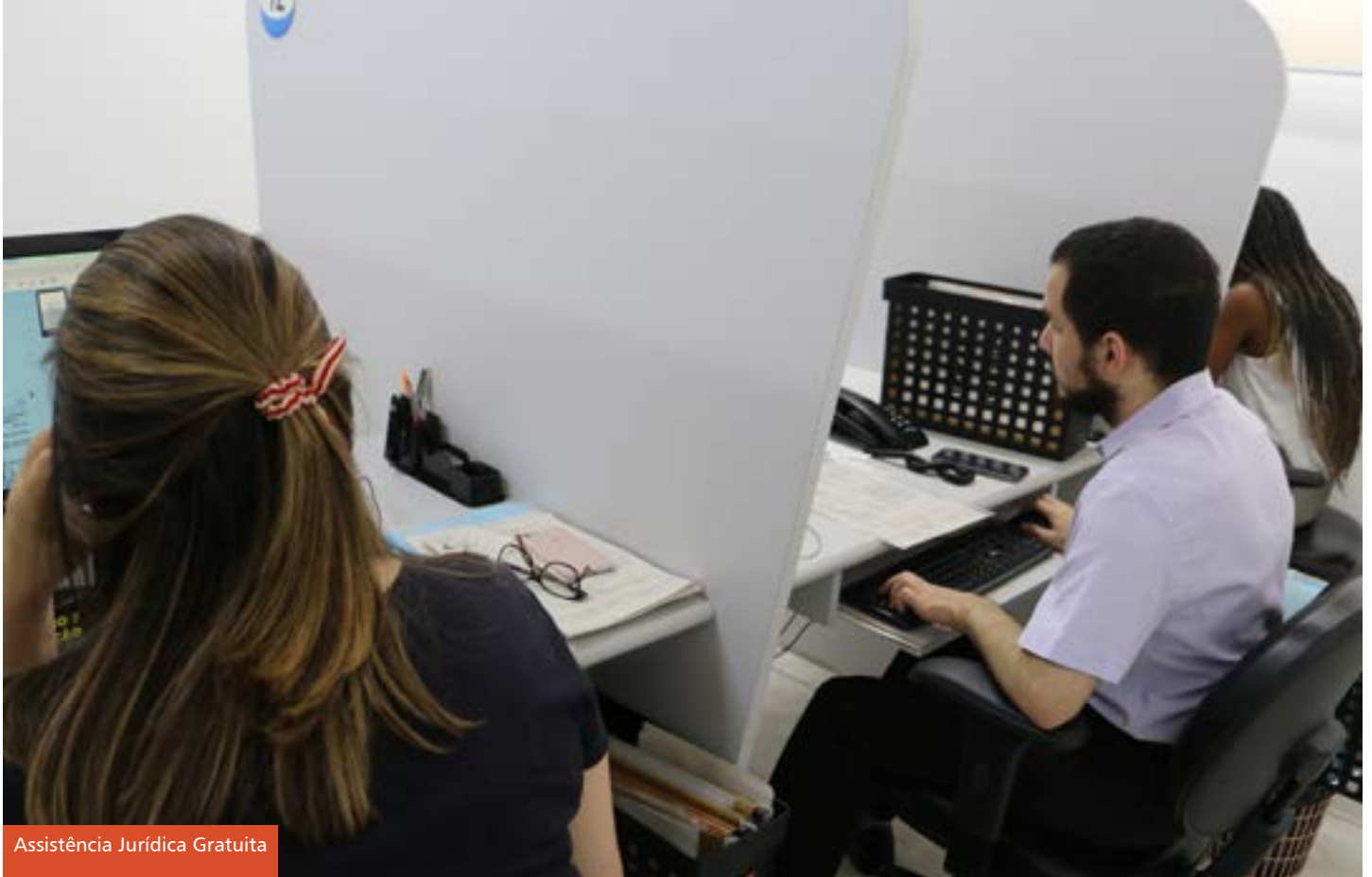
Assistência Jurídica Gratuita

Além destas iniciativas, comunidade acadêmica se junta aos servidores para realizar o Direito na Palma da Mão. O projeto social funciona há quase 20 anos e consiste em realizar visitas em escolas de São Bernardo do Campo para a realização de palestras e prestação de orientação jurídica aos pais e familiares dos alunos, assim como aos demais interessados que comparecem ao local do atendimento. O serviço engloba todas as áreas do Direito, principalmente dúvidas ligadas ao Direito Civil, de Família, Trabalho, do Consumidor e Previdenciário. As ações reforçam a