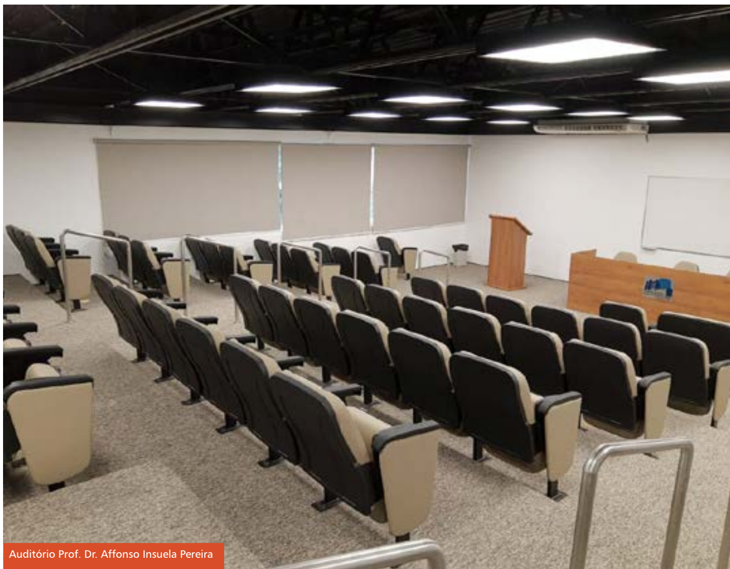
Auditório Prof. Dr. Affonso Insuela Pereira

To further celebrate this work, the Diversity and Social Inclusion Course: Citizenship and Fundamental Rights were nominated for the renowned Innovare Award, competing in the “Justice and Citizenship” category. Integrating this award is in line with FDSBC’s mission, which is to foster gender equity and the appreciation of human beings.