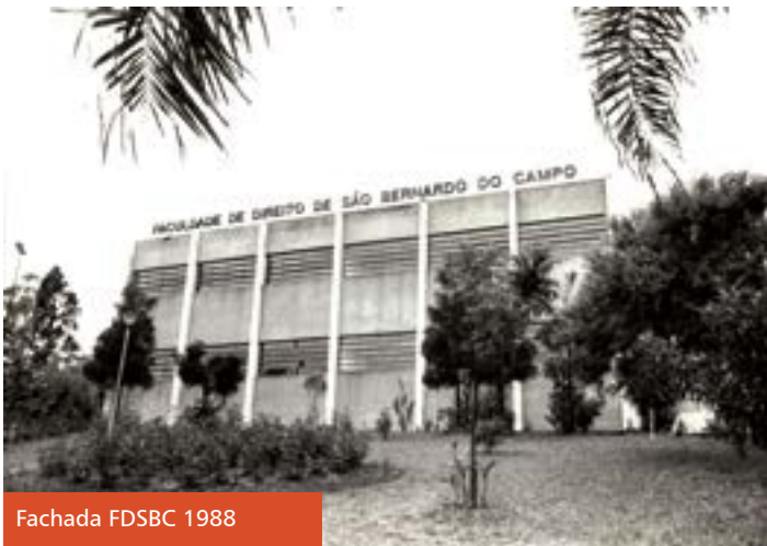
Fachada FDSBC 1988

The Faculty joins efforts to carry out the retrofit, a project that transforms the campus into an even more comfortable and inclusive place for everyone. The spaces, including the entrance, auditoriums, patios, and others, have undergone renovations that modernize but also ratify the constant concern with accessibility, where elevators and access ramps were installed in the structure. "We believe that everyone should have the same rights and socialize in an environment that favors learning and also the realization of various activities that promote the coexistence of our community